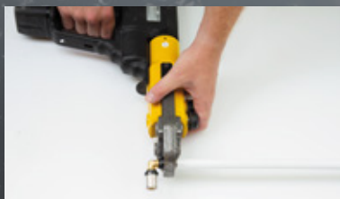
04. Zacisk złączki