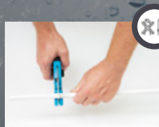
01. Cięcie rury