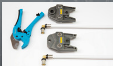
05. Kompatybilność szczęk z „U” i „TH”