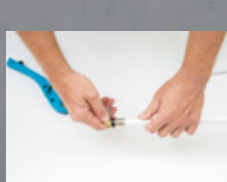
03. Montaż złączki